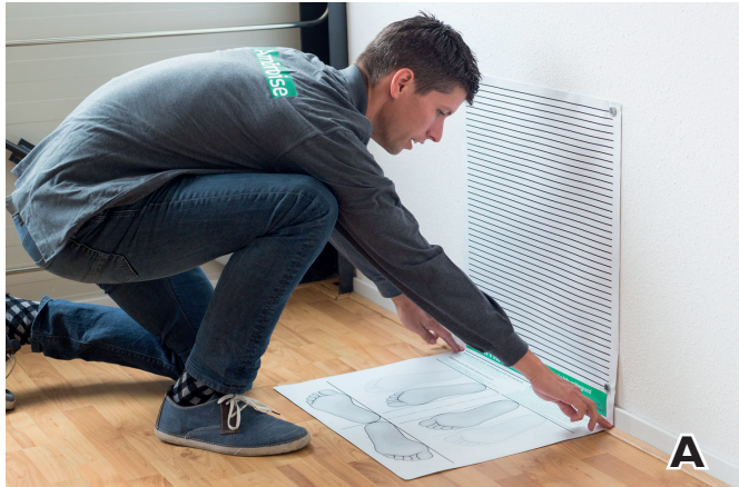
A. Falten Sie das Poster auf der schwarzen Linie unter dem Logo auf dem Boden/ an der Wand.