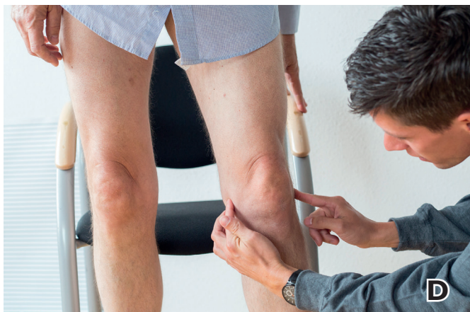
D. Bestimmen Sie die anatomische Knieachse.