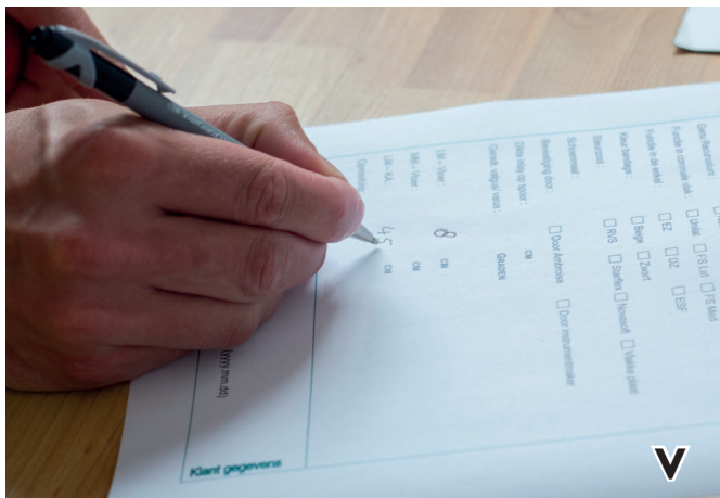
V. Notieren Sie die Maße im Genux/UTX Messprotokoll.