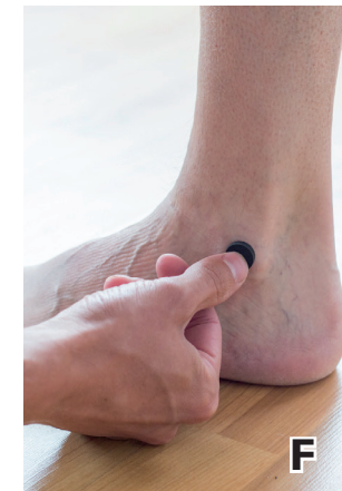
F. Markieren Sie den lateralen Knöchel des Fußgelenks.