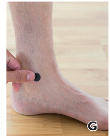
G. Markieren Sie den medialen Knöchel des Fußgelenks.