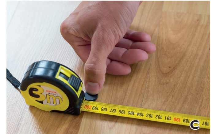
C. Markieren Sie den zuvor gemessenen Abstand auf dem Boden.