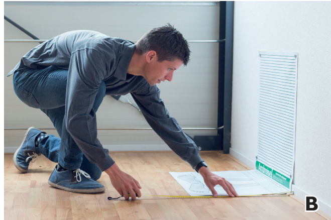
B. Messen Sie einen Abstand von 2 Metern zur Wand ab.