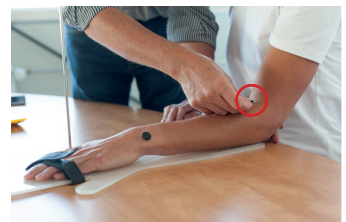
F. Markieren Sie zum Schluss die Ellbogenhöhle.