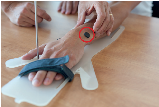
E. Plaats ook een marker ter hoogte van de ulna styloid process op de pols.