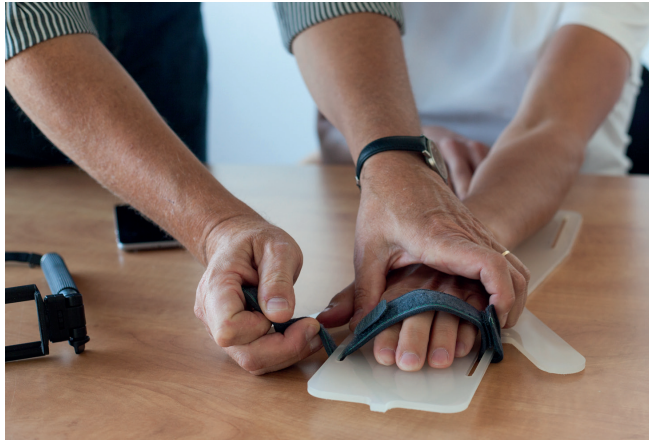
B. Plaats de hand op het maatname plankje. De klittenbandsluiting houdt de hand op zijn plek.