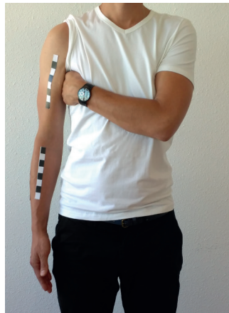
G. Dit is de frontale foto.