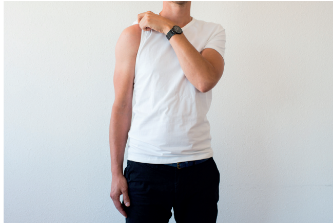
B. Zorg dat de aangedane arm geheel in beeld is.