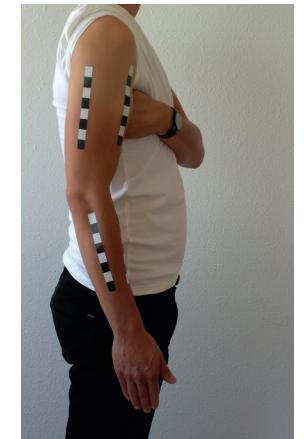
I. Dit is de sagittale foto.