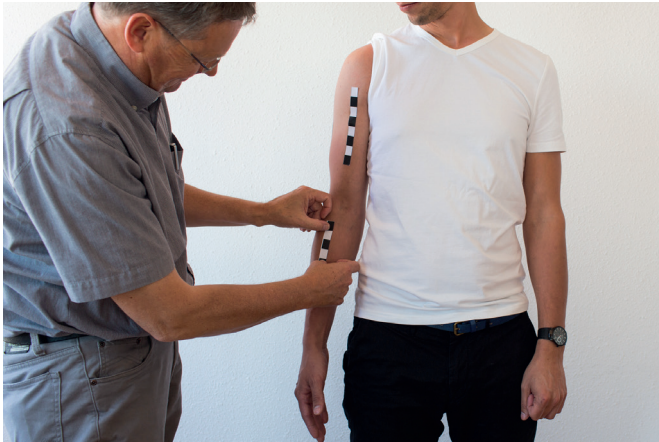
G. Plak de derde sticker frontaal op de onderarm.