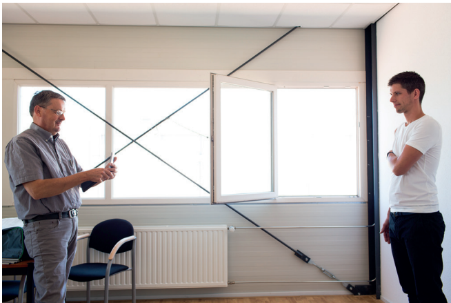
F. Maak een frontale foto op een afstand van minstens 1 meter (bij voorkeur 2 meter). Houd de camera verticaal en op ellebooghoogte.