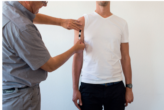
E. Plak de de tweede sticker frontaal op de bovenarm.