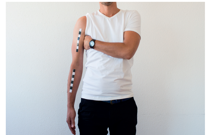
I. Houd een hand onder de oksel, zo hoog mogelijk, zodat de arm de romp niet raakt, en de bovenkant van de arm zichtbaar is.