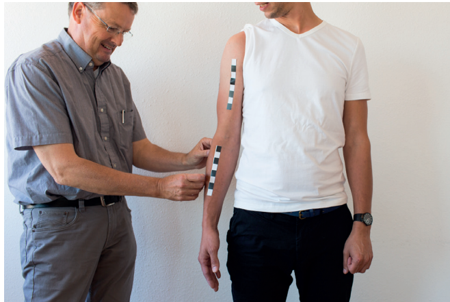
H. Plak de vierde sticker sagittaal op de onderarm.