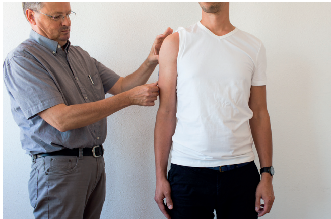
D. Plak de maatname sticker sagittaal op de bovenarm.