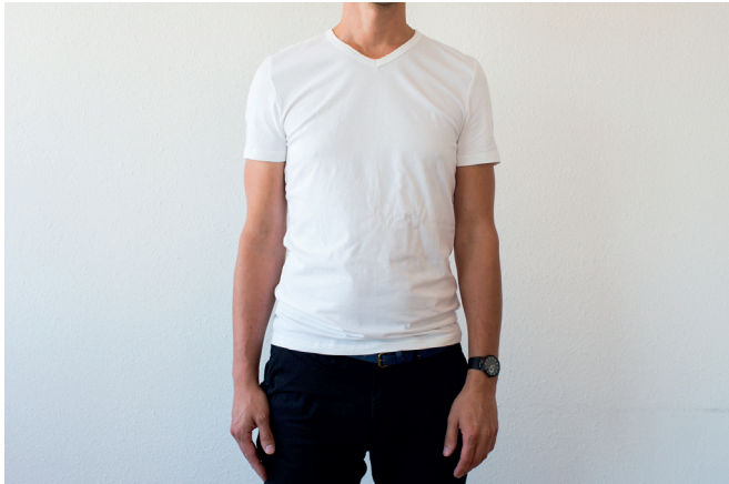
A. Neem plaats voor een rustige achtergrond.