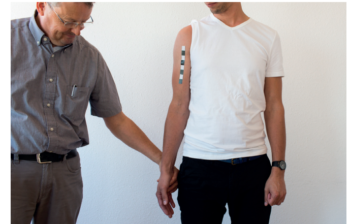
F. Zorg nu dat de duim naar voren wijst.